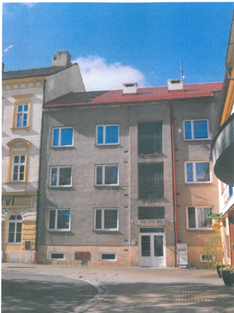
Příloha č. 1: foto bytu č. 2 v domě č.p. 18 náměstí T.G. Masaryka, Holice